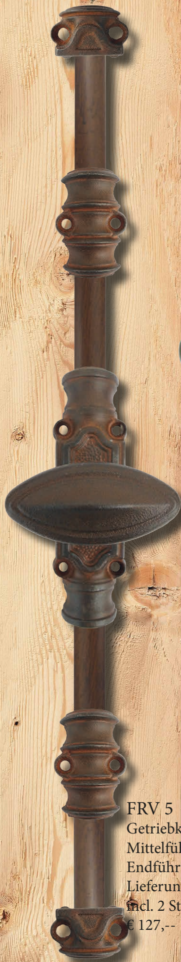
FRV 5 Getriebkastengröße : 36 x 130 mm Mittelführung : mm Endführung : mm Lieferung erfolgt incl. 2 Stangen 1,4 x 100cm. € 127,--