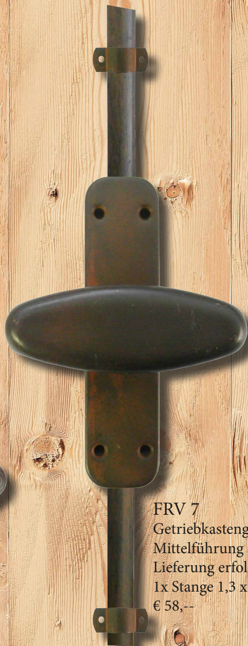
FRV 7 Getriebkastengröße : 32 x 125 mm Mittelführung : 15 x 37 mm Lieferung erfolgt incl. 1x Stange 1,3 x 1600 mm € 58,--